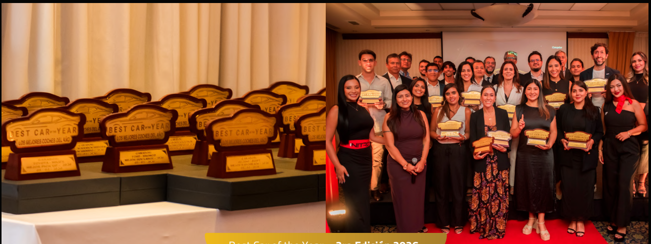
Best Car of the Year – 3ra Edición 2026